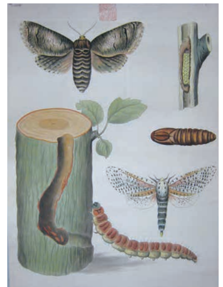
昆蟲學に關する掛圖 小泉春泉